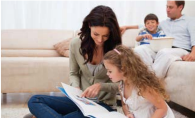
The supply with natural gas will remain secure during the conversion.

Because L-gas is steadily declining, the natural gas network will be gradually converted to H-gas – in 2018 then in Ostercappeln. As the gas network operator in the region, Westnetz is taking charge of this so-called market area conversion. The basis for this is the network development plan for the German gas network, which the gas network operators have developed in coordination with the Federal Network Agency.