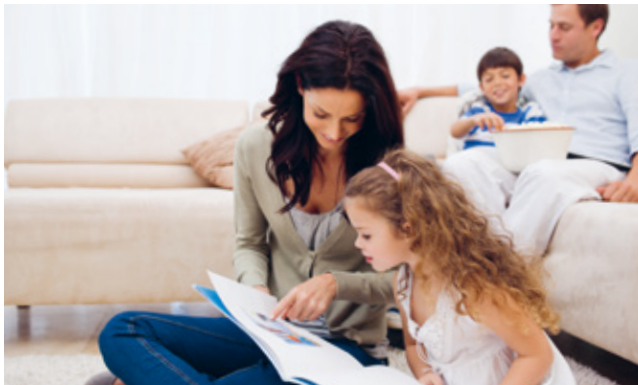
Die Versorgung mit Erdgas bleibt während der Umstellung gesichert.

Weil das Erdgas L langsam zur Neige geht, wird das Erdgasnetz nach und nach auf das Erdgas H umgestellt – so auch 2022 in Herscheid. Um diese sogenannte Markttraumumstellung Gas kümmert sich Westnetz als Gasnetzbetreiber in der Region. Die Grundlage bildet der Netzentwicklungsplan für das deutsche Gasnetz, den die Gasnetzbetreiber in Abstimmung mit der Bundesnetzagentur entwickelt haben.