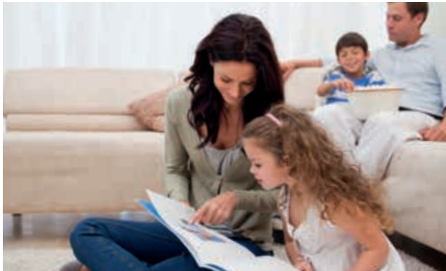
The supply with natural gas will remain secure during the conversion.

Because L-gas is steadily declining, the natural gas network will be gradually converted to H-gas – in 2018 then in Belm. As the gas network operator in the region, Westnetz is taking charge of this so-called market area conversion. The basis for this is the network development plan for the German gas network, which the gas network operators have developed in coordination with the Federal Network Agency.